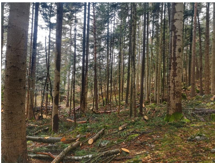
Bild 2: Beispiel einer naturnahen Durchforstung im Dauerwaldprinzip im Gebiet Läribaracke, Ausführung Winter 2023/24.