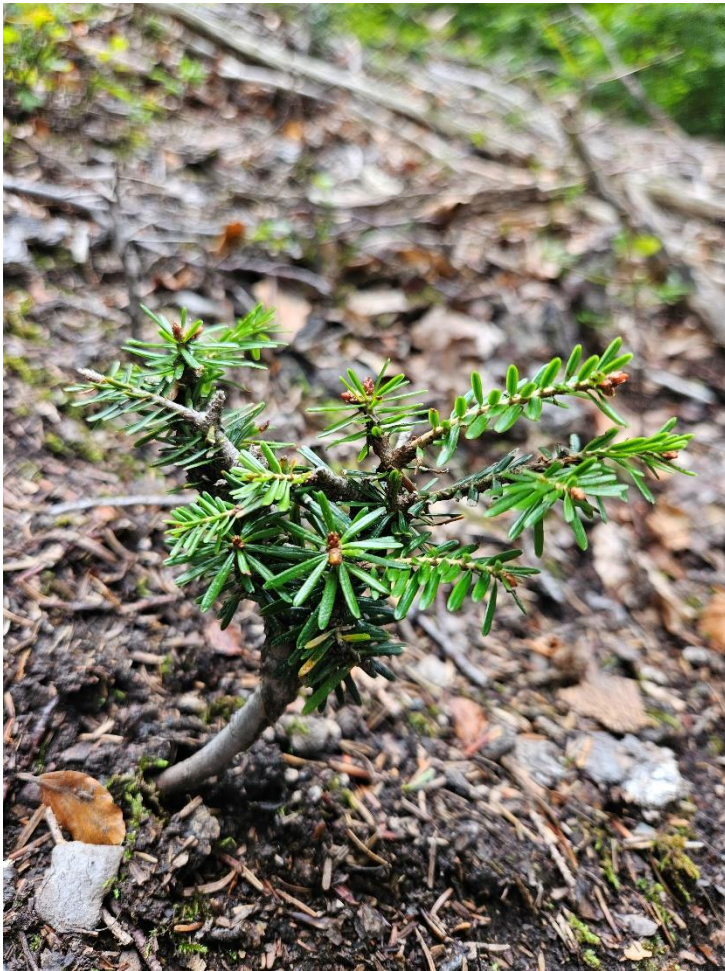
Bild 3: Verbissene Weisstanne im Maienfelder Wald. Der Verbiss durch Wildtiere wie Rehe, Hirsche und Gämsen führt zu einer Veränderung der Waldstruktur und kann langfristig die Gesundheit und Stabilität unsere Waldes gefährden.