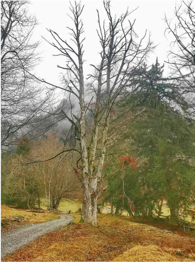
Bild 1: Eine absterbende Buche im Gebiet Martinsbrunnen. Diese Schäden sind ein direktes Ergebnis der Trockenheit und Hitze seit dem Sommer 2018.